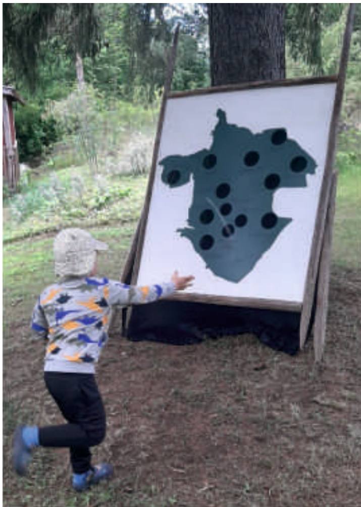
Ketjupeli oli erityisesti lasten suosiossa, Ketjupeli on tehty Metsämaalla,