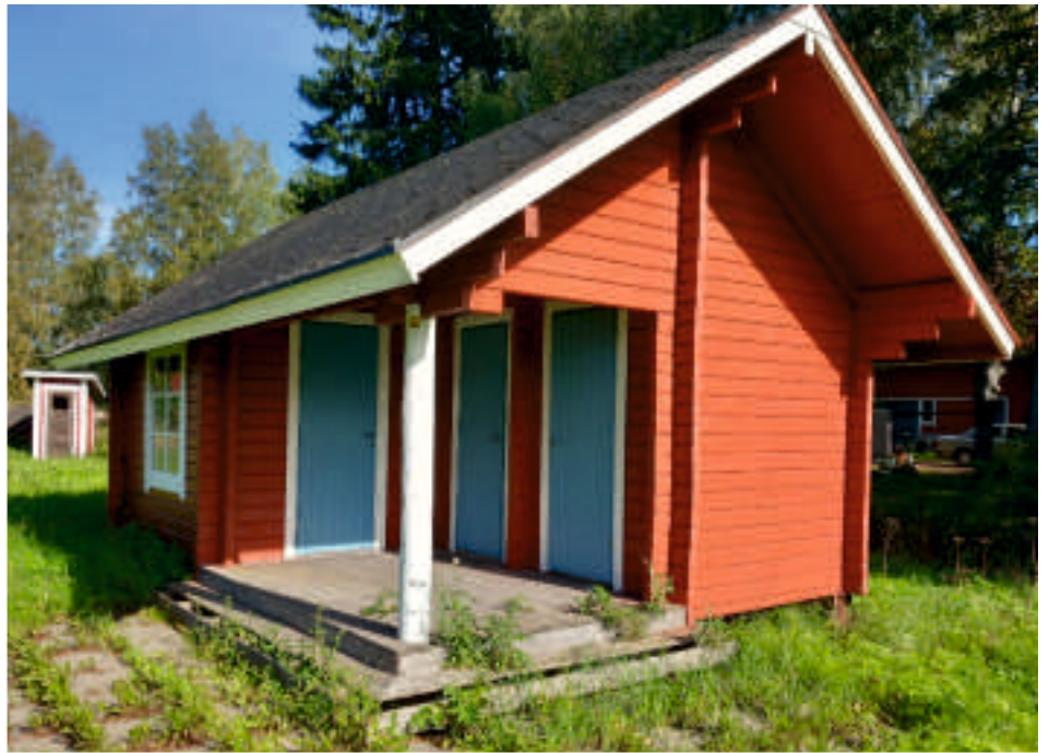
Uimarannan huoltorakennus sai kesän aikana uuden maalipinnan. Myös sisätilat maalattiin.

Loimaan kylät olivat mukana Loimaan kaupungin osastolla Okrassa 5.-8.7.2023. Loimaalaiset kylät olivat saaneet talkoovoimin tehtyä hienon osaston, jossa riitti tekemistä niin lapsille kuin aikuisillekin. Kylien osasto ja sen esitely toteutettiin talkootyönä.