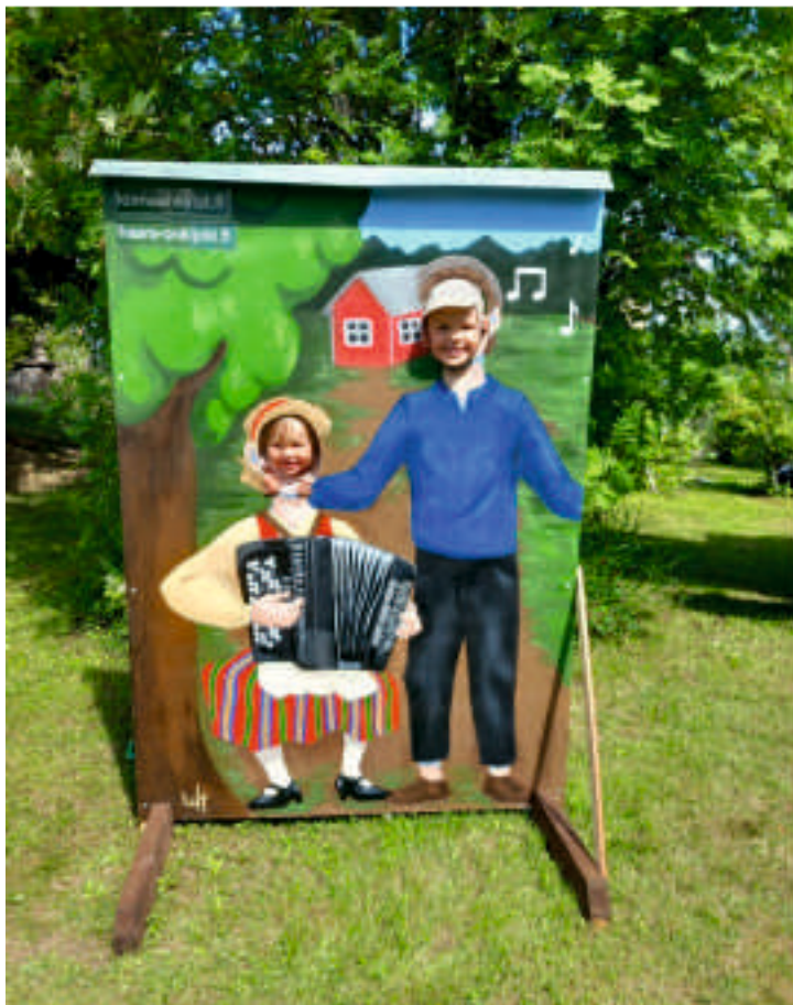
Tintamareski on tehty Haara-Onkijoella

Nähdään taas ensi heinäkuussa Pajamäellä!